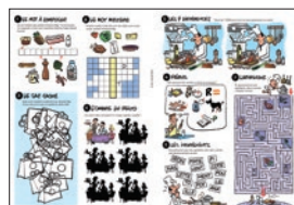
Info gaspillage alimentaire et jeux

La promotion du gourmet bag a été inscrite par l'UMIH en 2013 dans le Pacte national de lutte contre le gaspillage alimentaire.