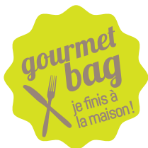
Sticker vitrine (11 cm) + sticker menu (3 cm)

Afin de vous accompagner au mieux, la CCI de Saône-et-Loire et ses partenaires vous proposent un kit d'outils visant à développer l'usage du gourmet bag au sein de votre établissement.