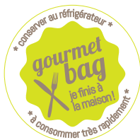
Sticker boîte (5 cm)